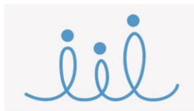
FOND EUROPSKE POMOĆI ZA NAJPOTREBITIJE