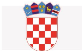
MINISTARSTVO ZA DEMOGRAFIJU, OBITELJ, MLADE I SOCIJALNU POLITIKU